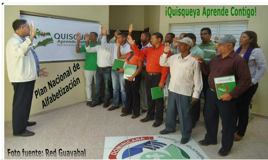
Reuniones de coordinación de las juntas municipales.