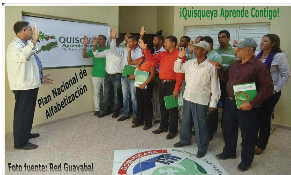
Reuniones de coordinación de las juntas municipales.